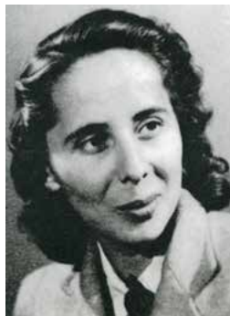
Laure DIEBOLD MUTSCHLER, compagnon de la Libération