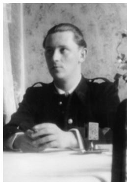
André AALBERG, compagnon de la Libération