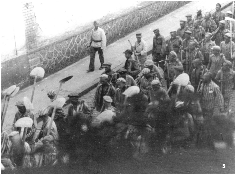
5. DÉPORTÉS SLOVÈNES SE RENDANT DE L'USINE DIEHL VERS LE TUNNEL DE SAINTE-MARIE-AUX-MINES - COLL. GEORGES JUNG - 1944

En 1939, la 2 nd e Guerre mondiale éclate. En 1944, les Allemands installent dans le tunnel une usine destinée à produire des pièces détachées pour moteurs d'avions. 2000 déportés, venus du camp de Natzweiler- Struthof en Alsace, y travaillent plus de 12 heures par jour et 18 heures le samedi. Ces prisonniers sont d'origines russe, polonaise, belge, italienne mais également yougoslave. De nombreux Ste-Mariens font acte de générosité. Les travailleurs « réquisitionnés » pour travailler avec les déportés dans le tunnel leur apportent discrètement de la nourriture. En septembre 1944, devant l'arrivée des Américains, les Allemands transfèrent les prisonniers à Dachau et font sauter l'entrée du tunnel.