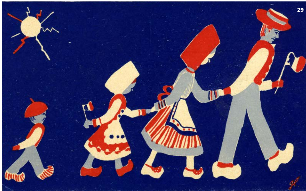
29/30/31. Cartes postales éditées en janvier 1945 au profit de l'effort de guerre pour la Libération