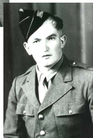
Marcel Jehel