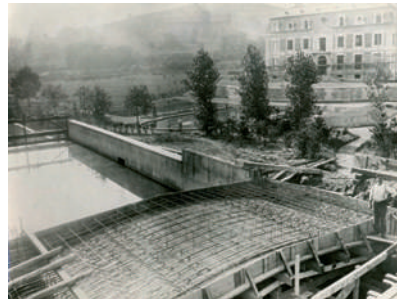
La construction fut confiée à l'entrepreneur local Sautter. Un pont sur la Lièpvrette a dû être construit pour accéder également depuis le parc à la rue principale.

André Burrus fait construire une première maison en 1911, à l'entrée de la rue de la Gare de Sainte-Croix-aux-Mines. Fort de sa notoriété et de sa richesse, il fait par la suite ériger une demeure avec un vaste parc pour s'adonner à sa passion de la botanique. Pour ce faire, il rachète les terrains longeant la rue de la Gare, encore inoccupés à cette époque. Les plans sont dessinés en 1931 par les architectes mulhousiens Schulé et Doll et la construction débute très rapidement. L'édifice est achevé en 1935, malgré un retard dans la construction dû à la crue du ruisseau voisin de la Lièpvrette. La villa Burrus avec son parc de 3,4 hectares et ses dépendances constituent un ensemble architectural caractéristique de l'ère florissante du patronat industriel.