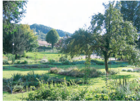
La tempête de 1999 a fortement endommagé le parc. Certains arbres ont été remplacés, modifiant constamment le patrimoine arboricole du jardin.