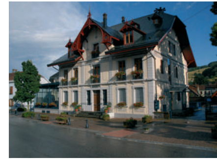
La mairie de Sainte-Croix-aux-Mines a conservé l'architecture que ses premiers occupants lui avaient donnée.

Il reste à Sainte-Croix-aux-Mines d'autres maisons construites par les premiers Burrus, à l'instar de l'actuelle mairie. Installée sur le site de l'ancienne brasserie de Sainte-Croix, Martin Burrus la fait démolir pour y construire sa demeure familiale en 1889. Elle garde un aspect traditionnel, comparé aux autres maisons familiales des Burrus. Elle dispose d'une belle véranda d'époque en fer forgé. La façade est dépouillée mais le fronton est orné d'un décor en bois ajouré qui reprend la tradition des chalets suisses. L'aménagement des pièces a reçu un soin particulier : poêle en faïence monumental, surmonté des initiales de Martin Burrus, boiseries et fresques murales peintes au plafond de l'actuel bureau du maire. A partir de 1905, elle a servi de maison au directeur de l'usine à gaz de Sainte-Croix-aux-Mines et elle accueille la mairie depuis les années 1950.