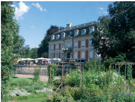
La Villa Burrus est le siège de nombreuses activités culturelles tout au long de l'année.