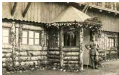
Baraquement militaire « Pfortzheimer Hütte »