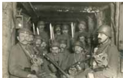
Soldats allemands dans une tranchée souterraine au Violu, équipés de masques à gaz

En raison de la faible distance séparant les tranchées ennemies, les pionniers allemands et les sapeurs français pratiquent la guerre des mines. Elle consiste à creuser des galeries sous les positions ennemies, et de les faire sauter à l'aide d'explosifs. La guerre des mines apparaît comme l'une des pratiques originales de la guerre dans les Vosges entre juin 1915 et avril 1916. En 1916, les armes chimiques sont utilisées au Violu, par le tir d'obus dégageant des gaz meurtriers sur les tranchées ennemies. Mais cette arme peu sûre est vite abandonnée, en raison des aléas météorologiques.