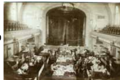
Théâtre de Sainte-Marie-aux-Mines, transformé en hôpital militaire

La présence permanente de près de 20.000 militaires change radicalement le visage des communes du Val d'Argent, car toutes les infrastructures municipales sont réquisitionnées pour l'effort de guerre. A Sainte-Marie-aux-Mines, le théâtre municipal est transformé en hôpital de campagne, les usines et écoles sont employées pour le cantonnement, le bureau de poste est occupé par le courrier militaire, les bains municipaux sont réservés à l'usage des troupes au repos. Moins exposée aux tirs d'artillerie, la commune de Lièpvre abrite les réserves stratégiques (fourrages, munitions) à proximité de la gare et un hôpital militaire dans l'usine Dietsch. Les cités s'animent au rythme des convois de toutes sortes : militaire, funèbre, prisonnier. Des concerts dominicaux de musique militaire se tiennent également sur les places communales.