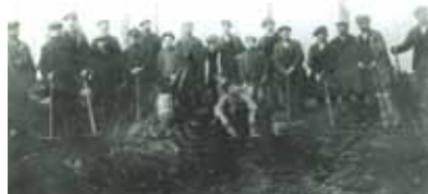
Comblement des tranchées au Violu en 1921