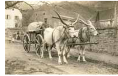
Chariot tracté par des bœufs roumains

Dès lors, il s'agit de fortifier une ligne de front allant du Haïcot à la Chaume de Lusse et culminant à près de 1 000 m d'altitude, pour la tenir durablement avec des effectifs réduits. Au fur et à mesure de l'avancement de la guerre, l'aspect technique devient prédominant et nécessite la présence de nombreuses petites unités spécialisées. Durant les 4 années de guerre, le front sainte-marien accueille une diversité incroyable de troupes, pour répondre aux problématiques spécifiques de la guerre de montagne.