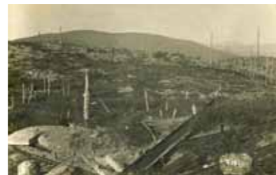
Le Violu est régulièrement pilonné par l'artillerie en raison de son emplacement stratégique

Du 31 octobre à début novembre 1914, les unités françaises disputent le Violu aux bataillons allemands. Appuyés pour la première fois dans ce conflit par l'artillerie, les soldats français se rendent maître définitivement du Violu le 12 novembre 1914. Le front se stabilise sur l'ancienne crête-frontière : les Français conservent le col du Bonhomme et le Violu, tandis que les Allemands gardent le col de Sainte-Marie, les pitons du Pain de Sucre et du Bernhardstein.