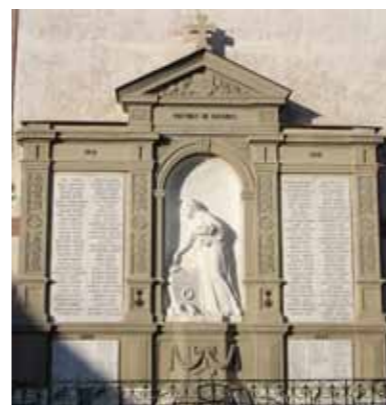
Monument aux morts de Sainte-Croix-aux-Mines

Dès les années 1920, les premiers monuments aux morts voient le jour et sont érigés au cœur des communes. Dans le Val d'Argent comme dans les anciens territoires annexés, la notion de « Mort pour la France » n'apparaît pas sur les monuments. Chaque monument aux morts a sa propre symbolique. Le monument de Sainte-Croix-aux-Mines représente une femme déposant une fleur sur un cénotaphe, rappelant que de nombreux soldats n'ont pas de sépulture reconnue. À Sainte Marie-aux-Mines, le monument aux morts représente une Alsacienne s'avançant vers une Marianne lui ouvrant ses bras, symbolisant le retour de l'Alsace à la France. Les monuments aux morts de Lièpvre et Rombach-le-Franc ont la forme d'un obélisque, portant les armoiries des communes (Lièpvre) ou représentant des orphelins (Rombach-le-Franc).