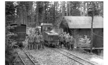
Chemin de fer à voie étroite Lordonbahn