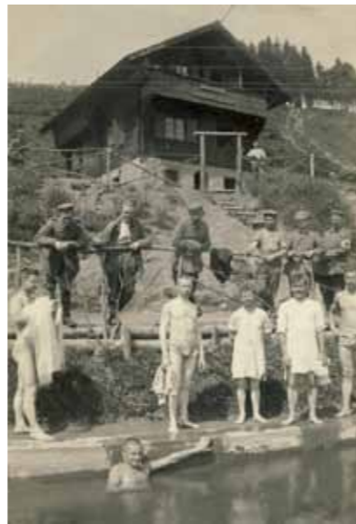
Piscine à la Côte d'Echery. A l'arrière plan, le « chalet suisse » abrite une unité sanitaire

Une multitude de baraquements en bois destinés au cantonnement à proximité des lignes, sont érigés à des endroits moins exposés. Ils forment de vrais villages avec leur chapelle et leur cimetière, comme par exemple à la Hegelau. Pour loger les troupes en repos des différentes unités, des baraquements sont construits jusque dans le moindre vallon. La vie s'organise sur le front, avec la création d'installations pour apporter un minimum de bien-être aux soldats : des services de santé, des stations d'épouillage et même une piscine chauffée sont établis à la Côte d'Echery, à proximité du secteur du Violu.