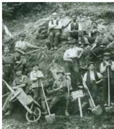
Équipe d'ouvriers n°12, démantelant les installations militaires au Rauenthal, en 1921

Soucieuse de la sécurité, la municipalité sainte-marienne fait démanteler les infrastructures militaires en bois et combler les tranchées à partir de 1919, par des habitants au chômage. Des adjudications sont faites à des ferrailleurs qui récupèrent l'acier, faisant même sauter des blockhaus à l'explosif. De ce patrimoine unique, il reste un nombre impressionnant de structures, plus ou moins bien conservées.