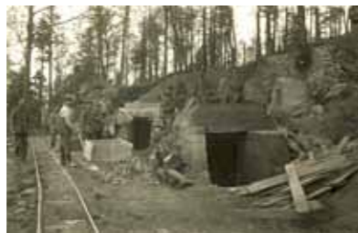
Construction de blockhaus. Les matériaux nécessaires sont acheminés par le réseau de transport militaire

La nécessité de protéger les troupes conduit très vite à construire des abris, en retrait des zones de combat, souvent à contre-pente. On utilise également des éléments préfabriqués en béton provenant du parc des pionniers de Sainte-Marie. En parallèle, des abris lourds en béton armé sont construits (positions de mitrailleuses, de Minenwerfer), tout comme des abris spécifiques à l'épreuve des bombes (postes de transmissions, de commandement, station électrique, sanitaires, cuisines...). Toutes ces infrastructures forment un immense complexe fortifié répondant aux critères d'une guerre de position.