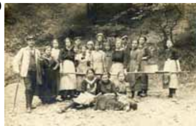
Femmes réquisitionnées au titre du Hilfsdienst

La population locale est également contrainte à participer à l'effort de guerre. Votée le 2 décembre 1916, la loi instaurant le Hilfsdienst (service auxiliaire) autorise l'administration militaire allemande à réquisitionner les hommes et les femmes de 15 à 60 ans pour exécuter des travaux divers. La plupart des hommes étant enrôlés dans l'armée active, les femmes se voient confier des travaux difficiles. Aux tâches traditionnelles de laveuses, blanchisseuses, cuisinières ou infirmières s'ajoutent des travaux de fenaison, voire de terrassement.