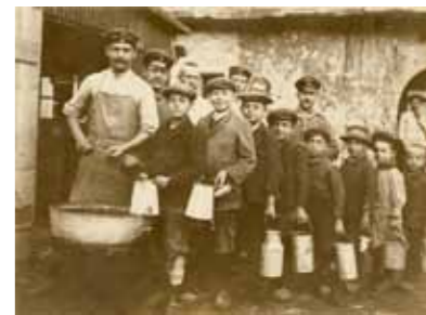
Distribution de soupe aux familles nécessiteuses

En parallèle, la majorité des habitants du Val d'Argent sont tenus de loger et de nourrir les gradés ou des soldats stationnant en permanence dans le secteur. Sainte-Marie-aux-Mines voit ainsi sa population doubler, voire tripler durant le conflit. Une telle situation n'est pas sans conséquence sur le ravitaillement. Plus la guerre se prolonge, plus la population civile connaît de privations : au fur et à mesure de l'avancement de la guerre, les produits de première nécessité se font de plus en plus rares. Dès 1915, le pain et la viande sont rationnés. Des cuisines roulantes militaires participent au ravitaillement des civils défavorisés.