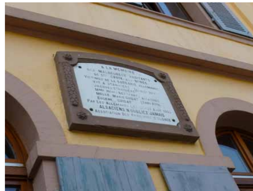
Plaque des Proscrits d'Alsace apposée sur l'école de Sainte-Croix-aux-Mines

Différentes localités en Val d'Argent présentent des plaques commémoratives, apposées aux bâtiments communaux. À Sainte-Croix-aux-Mines, l'une d'elles est visible sur la façade de l'école élémentaire. Ces plaques commémoratives ont été posées à l'initiative de l'Association des Proscrits d'Alsace, dont Maurice Burrus fut le cofondateur. Créée en 1919, cette association a œuvré pour la reconnaissance des droits des Alsaciens ayant dû combattre sous l'uniforme allemand, ou qui furent victimes de vexations de l'armée allemande en 1914-1918. Pendant la seconde guerre mondiale, la plupart des plaques des proscrits en Alsace furent démontées par le régime nazi.