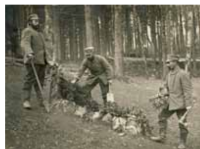
Sépulture militaire isolée à la Hegelau

Dans les premières années de la guerre, les soldats sont inhumés au plus près de l'endroit où ils sont tombés. De simples croix de bois isolées en pleine forêt marquent la sépulture d'un soldat, fleurie par ses camarades. Par la suite, des carrés militaires sont créés dans les cimetières communaux. En 1916 se forme le service allemand des sépultures militaires, qui aménage et entretient les nombreux cimetières. En 1916-1917, ce service fait ériger le cimetière monumental de Mongoutte. Les tombes sont alignées de part et d'autre d'une croix en granit monumentale, dont le médaillon de bronze représente un soldat allemand. Le ruisseau qui coule au milieu du cimetière renvoie à la symbolique du repos et de la paix. Les cimetières militaires français du col de Sainte-Marie et de la Hajus à Sainte-Croix-aux-Mines deviennent nécropoles nationales à la fin de la guerre.