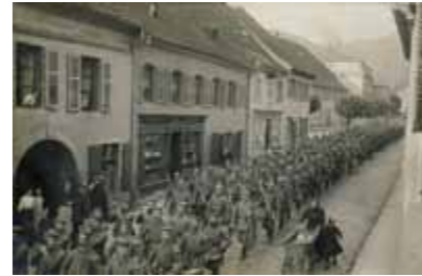
Soldats du 80e régiment d'infanterie de la Landwehr (LIR 80) redescendant du front

Avec la stabilisation du front sur la ligne de crête des Vosges, les états-majors prennent conscience que les batailles décisives de la Première Guerre mondiale seront livrées ailleurs et redéplient les troupes en conséquence. Si les premiers mois de guerre ont mobilisé plus de 100 000 soldats allemands, les effectifs militaires se stabilisent dans le Val d'Argent autour de 20 000 hommes, dont un quart occupe la ligne de front par alternance.