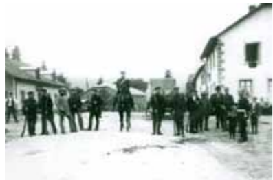
Poste frontière au col de Sainte-Marie, vers 1910

Les bruits de guerre attisent les tensions sur la frontière. Dès le 31 juillet 1914, l'arrivée de chasseurs et d'artilleurs allemands laisse présager l'affrontement. Le 1er août, les autorités militaires allemandes réquisitionnent des civils pour aller creuser des retranchements à différents points stratégiques au col de Sainte-Marie, tandis que la mobilisation est proclamée. Le 3 août, la guerre est déclarée, et des accrochages violents se produisent le jour même au col de Sainte Marie.