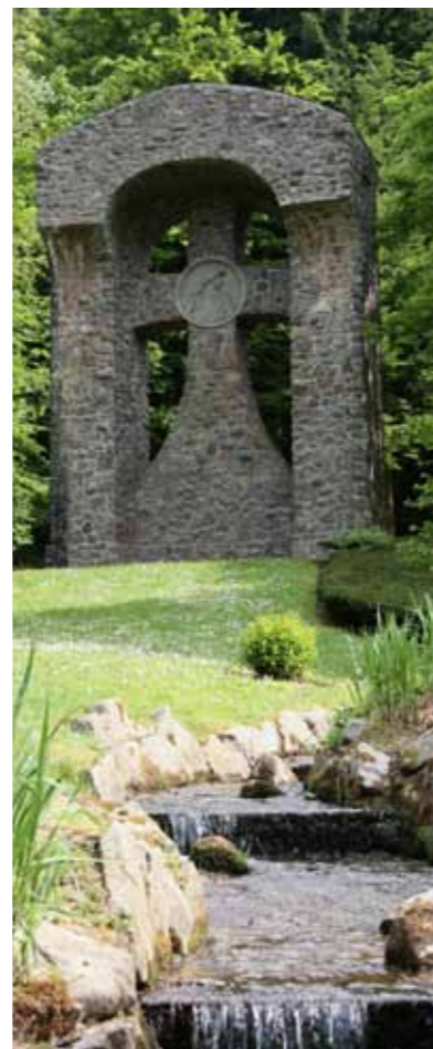
Cimetière militaire allemand de Mongoutte