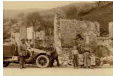
Ferme détruite par les combats d'août 1914 à Musloch