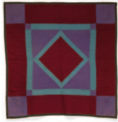
Quilt Amish traditionnel

Du début du 17e siècle jusqu'à 1670, de nombreux anabaptistes émigrent vers l'Alsace, et trouvent refuge pour certains d'entre eux dans le Val d'Argent. A l'époque, le territoire est divisé en deux moitiés distinctes, l'une lorraine, l'autre alsacienne. Le côté alsacien compte deux communautés réformées et une luthérienne, en raison de la conversion des seigneurs de Ribeaupierre au protestantisme. Peu à peu, les anabaptistes s'intègrent à la vie publique et paroissiale locale.