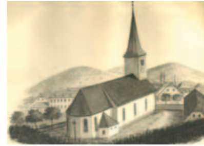
Église de la paroisse Saint Louis à Sainte-Marie-aux-Mines. État originel du bâtiment

Après l'expulsion de 1712, les Amish trouvent refuge dans les principautés autonomes voisines, telles que la principauté de Salm ou le Comté de Montbéliard. Louis XV les tolère à nouveau dans le Royaume de France, et certaines familles reviennent s'installer en Val d'Argent. Cependant, les guerres napoléoniennes et la conscription obligatoire accélèrent l'émigration anabaptiste vers les Etats-Unis, où une communauté Amish s'est établie en Pennsylvanie dès 1737. Là, les Amish ont donné leurs lettres de noblesse à l'art du patchwork, par la confection de quilts traditionnels aux formes géométriques.