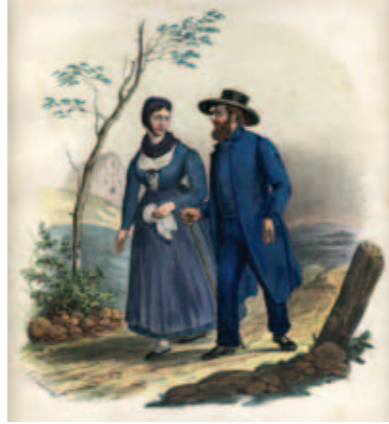
Un couple d'anabaptistes vers 1830

L'entrée dans la communauté se fait par le baptême, et marque dès lors l'acceptation de vivre selon les règles de l'Ordnung.