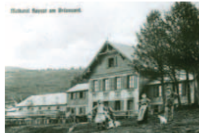
Laiterie du Haïcot

Les Amish s'installent sur les hauteurs du Val d'Argent, pour rester à l'écart de la société (principe de la Meidung ou de « l'évitement »). Vivant de l'agriculture et du travail du bois, ils introduisent des méthodes de culture efficaces. Dans un rapport du début du 18e siècle, ils sont décrits comme des fermiers capables « de mettre en culture les terres stériles et arides [et de les convertir en] terres labourables et plus beaux pâturages de la province ». Les Amish sont également éleveurs de bovins, dont ils sélectionnent les races pour obtenir de meilleurs rendements pour leurs laiteries. Autour de leurs fermes, ils créent des prairies artificielles pour y faire paître les troupeaux.